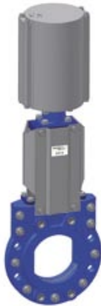
Pneumatisch aangedreven mesplaatafsluiter