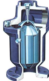
Be- en ontlufter